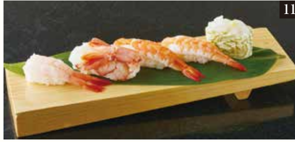
● 海老づくし5貫盛り ¥1,280 蒸し海老2貫、赤海老、甘海老、白海老