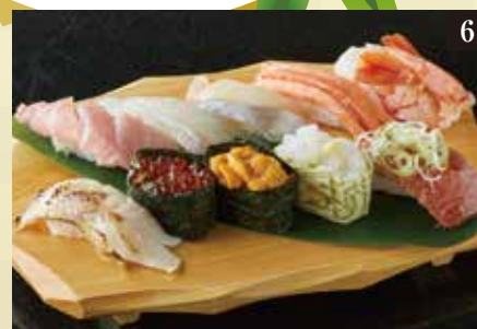
●極み 一人前 ¥3,480

本まぐろ大とろ、白身1種、青身2種、のど黒塩炙り、赤海老、紅ずわい蟹、白海老、いくら昆布メ、生うに