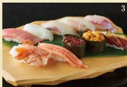
●上 一人前 ¥1,980

本まぐろ赤身、やりいか、えんがわ、サーモン、つぶ貝、蒸し海老、いなり、ねぎとろ、玉子、穴子