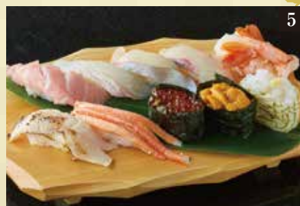
●特上 一人前 ¥2,980

本まぐろ中とろ、やりいか、白身2種、青身1種、赤海老、紅ずわい蟹、うなぎ、いくら昆布メ、生うに