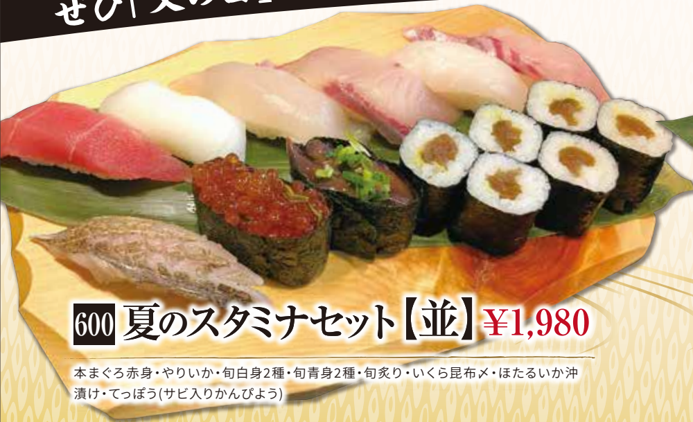
600 夏のスタミナセット【並】 ¥1,980

本まぐろ赤身・やりいか・旬白身2種・旬青身2種・旬炙り・いくら昆布メ・ほたるいか沖漬け・てっぽう(サビ入りかんぴょう)