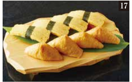
● いなり玉子セット ¥680 いなり4貫、玉子4貫