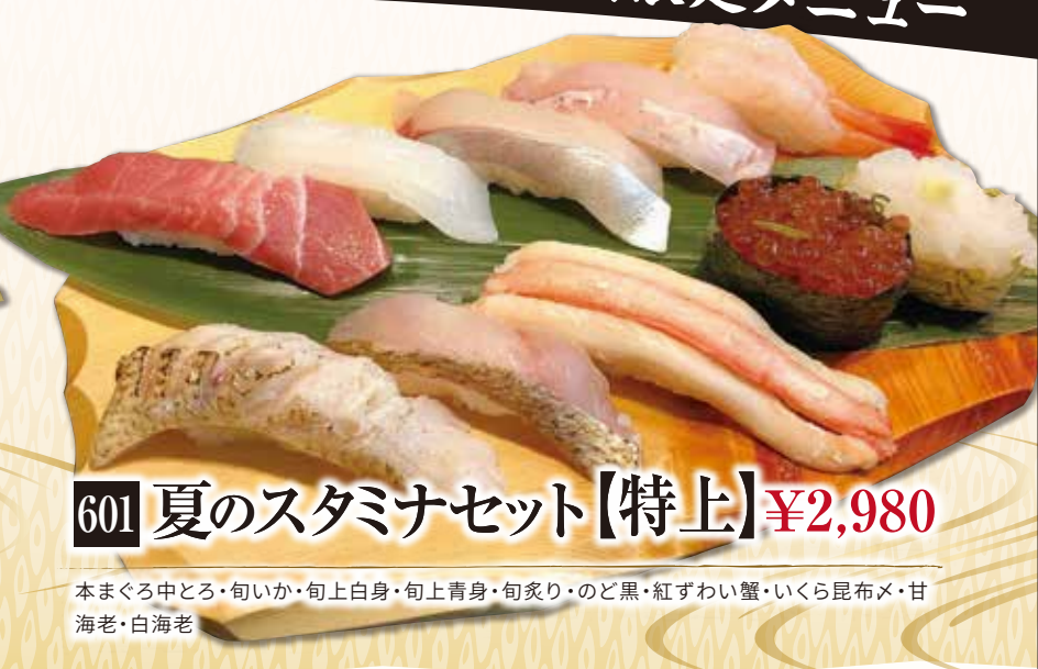
601 夏のスタミナセット【特上】 ¥2,980

本まぐろ赤身・やりいか・旬白身2種・旬青身2種・旬炙り・いくら昆布メ・ほたるいか沖漬け・てっぽう(サビ入りかんぴょう)