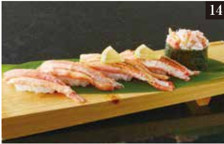
● 紅ずわい蟹づくし5貫盛り ¥1,480 紅ずわい蟹2貫、紅ずわい蟹塩炙り2貫、紅ずわい蟹軍艦