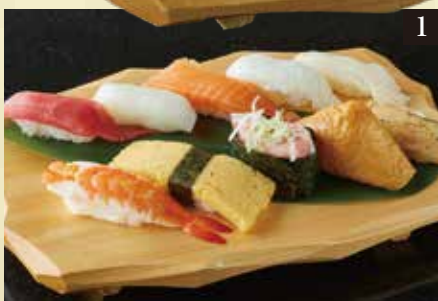
●お手軽 一人前 ¥1,200

本まぐろ赤身、やりいか、えんがわ、サーモン、つぶ貝、蒸し海老、いなり、ねぎとろ、玉子、穴子