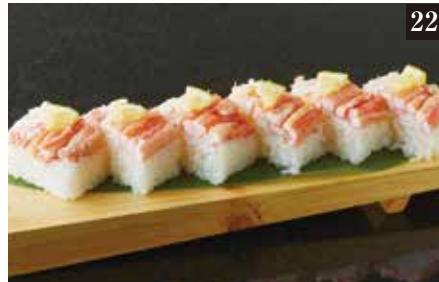
● 紅ずわい蟹押し寿司 ¥980