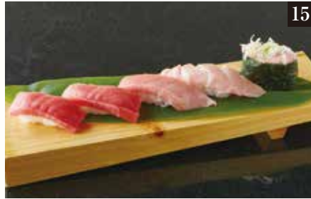
● 本まぐろづくし5貫盛り ¥1,680 本まぐろ赤身2貫、中とろ、大とろ、ねぎとろ