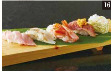
● 特選5貫盛り ¥1,980 本まぐろ大とろ、のど黒塩炙り、富山牛炙り 生うに乗せ、赤海老 いくら乗せ、白海老