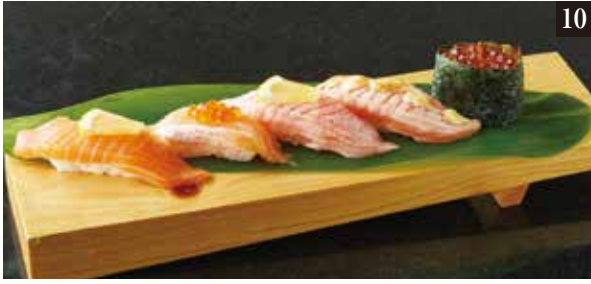
● サーモン5貫盛り ¥780 サーモン、サーモン塩炙り、サーモンマヨ炙り、とろサーモン、いくら昆布