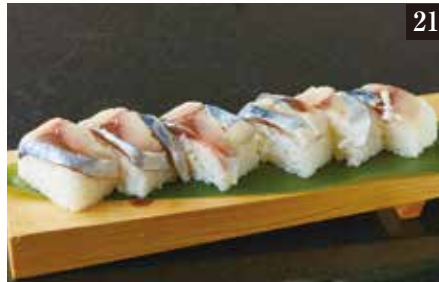
● 自家製メさば押し寿司 ¥780