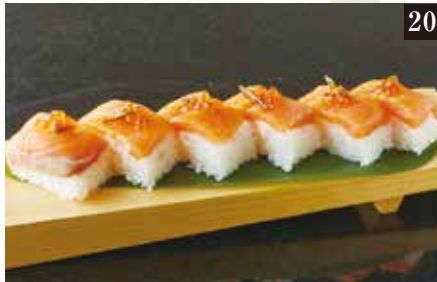
● サーモン押し寿司 ¥780