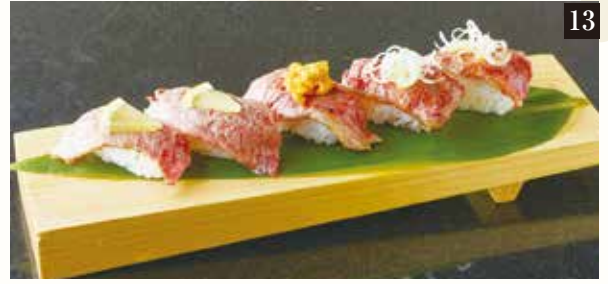
● 富山牛づくし5貫盛り ¥1,480 富山牛たれ炙り2貫、塩炙り2貫、富山牛炙りうのにせ