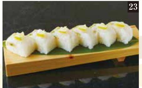
● 白海老押し寿司 ¥1,480